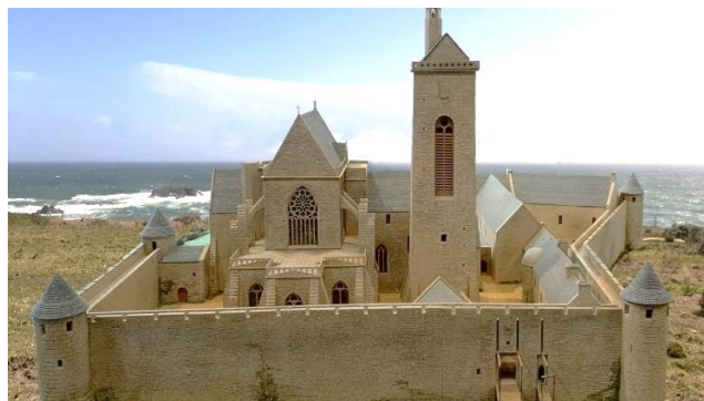
Maquette du musée sur fond de paysage environnant

La légende raconte que, ramenant le corps de l'apôtre Mathieu, des marchands du Léon auraient été miraculeusement sauvés du naufrage au large de cette pointe. Au VI ème siècle, pour abriter les reliques du saint, Tanguy y fonde le premier monastère. De l'abbaye subsistent aujourd'hui la façade romane, les voûtes de pierre du chœur et les arcades de la nef. Allez-vous y promener au crépuscule. C'est là, éclairée par le phare, qu'elle est la plus belle. Derrière, la chapelle Notre-Dame-de-Grâce abrite un petit musée contenant quelques vestiges de l'ancienne abbaye.