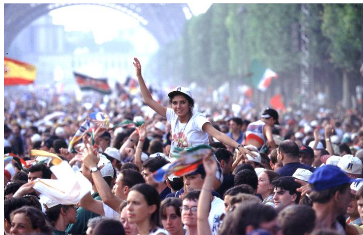
Les Journées Mondiales de la Jeunesse, le 19 août 1997, sur le Champ-de-Mars

J'avais 20 ans en 1997 quand le métro parisien a pris des allures exceptionnelles. On y