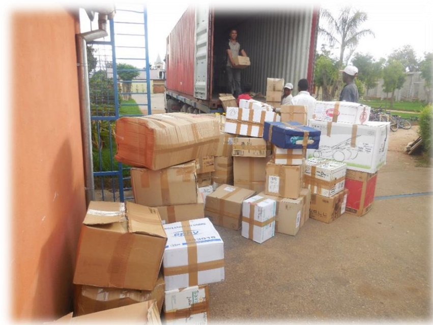
Le déchargement du container

Après de nombreuses tracasseries avec les services de la douane Malgache, il put réceptionner son container.