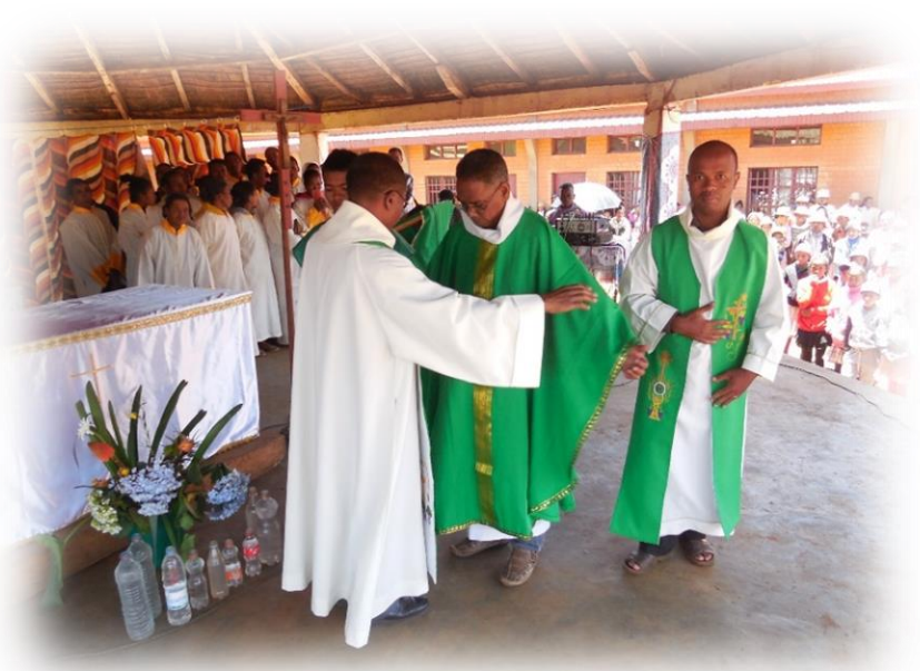
La remise de la chasuble le jour de la cérémonie