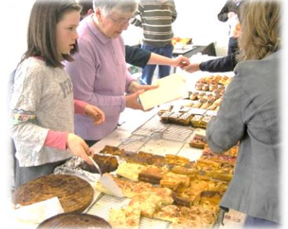
Les délicieux gâteaux

Les animatrices de l'ACE (Action Catholique des Enfants) tenaient aussi leur stand :