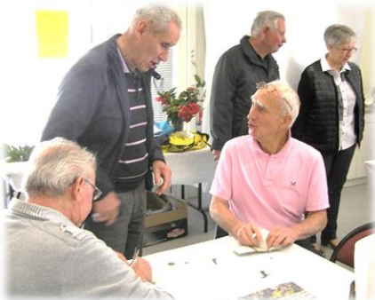
Achetez le billet gagnant !