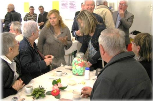
Conversation autour d'un café

La kermesse paroissiale s'est déroulée dans une ambiance de printemps ensoleillé. Gâteaux et crêpes à emporter ou à consommer sur place ont fait le bonheur des gourmands. Ceux qui le voulaient ont pu aussi s'asseoir un moment pour partager le verre de l'amitié.