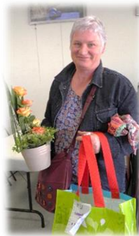
Une heureuse gagnante