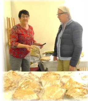
Les bonnes « crêpes maison »