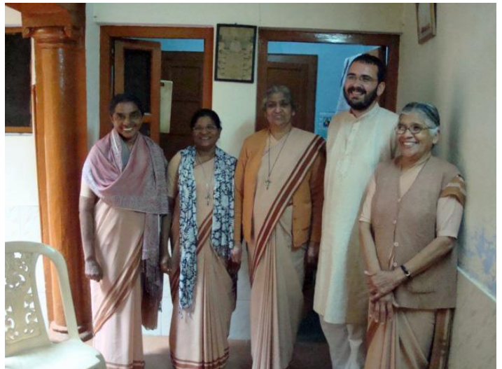
Aumônier des sœurs indiennes