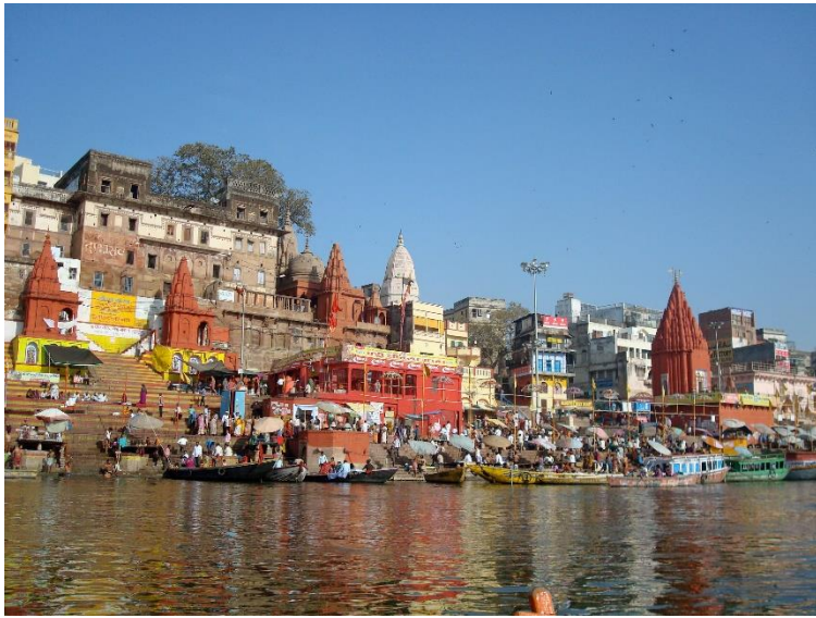
Les bords du Gange