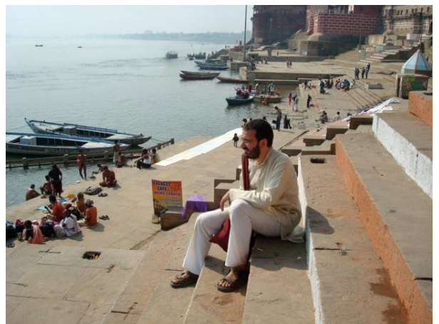
Sur les ghats

Plus profondément, le Français estime que l'hindouisme n'est pas sûr de lui. « C'est parce qu'ils pressentent que toutes leurs traditions sont menacées, qu'ils rêvent de rendre l'Inde aux hindous, résume-t-il. Et aussi parce qu'ils craignent - à tort - d'être convertis par les chrétiens ». D'où l'importance d'amitiés gratuites, exemptes de tout prosélytisme, suggère-t-il.